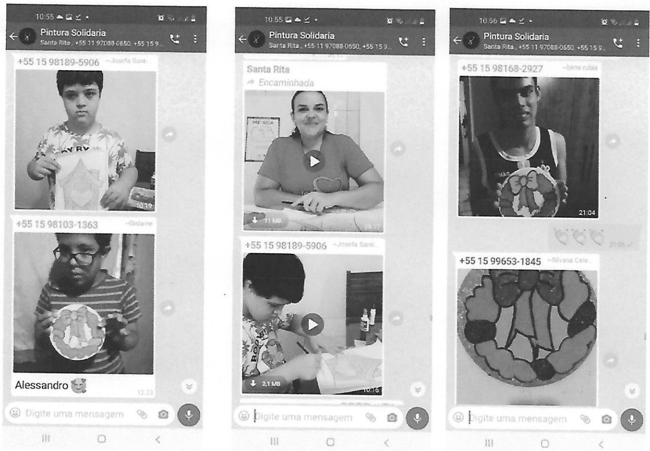
Fotos do Grupo do Whats App