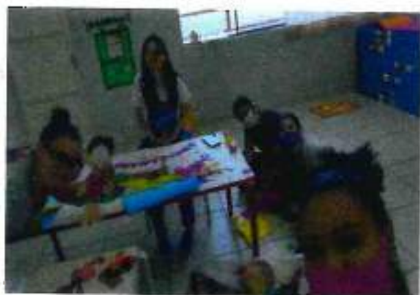
10/06- Decoração para volta as aulas