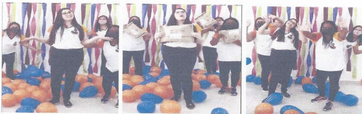
Vídeo convidando as famílias para a retirada do kit.