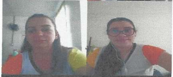
HTPC (online) – 21/10/2020