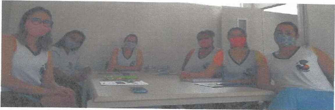
Reunião de Gestão – 06/10/2020