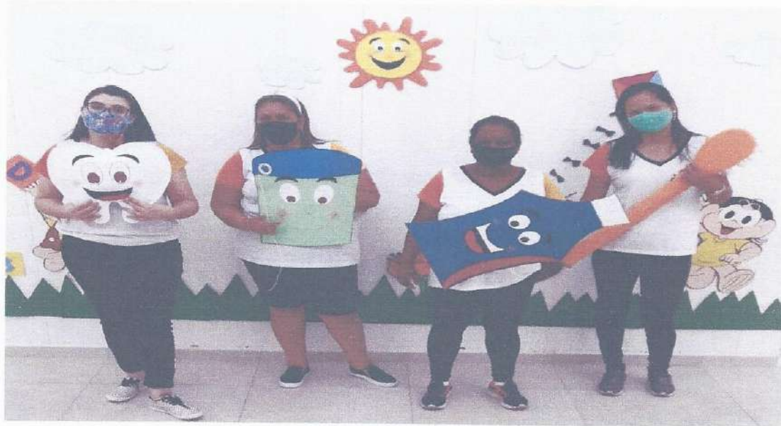
Equipe docente CEI 134