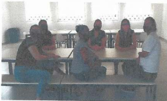
HTPC - 07/10/2020