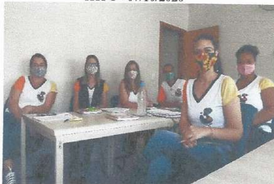
Reunião de Gestão – 20/10/2020