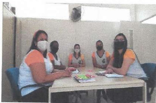
HTPC - 01/09/2020

Obs.: Todas as reuniões estão registradas em ata.