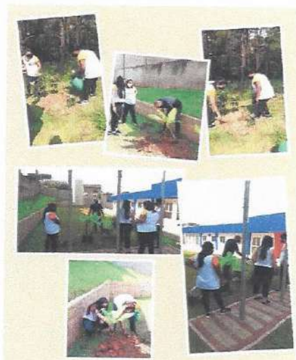
Dia da árvore - 21 de setembro