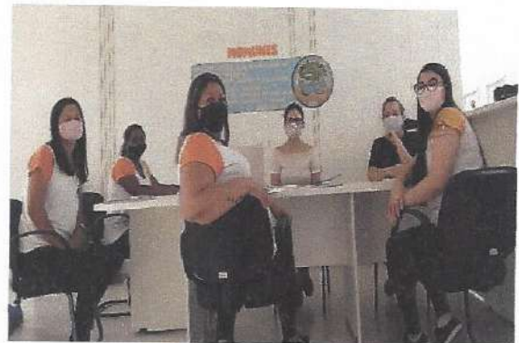
HTPC - 28/09/2020