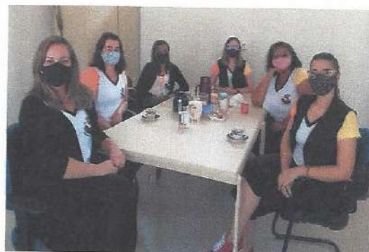
Reunião de Gestão – 02/09/2020