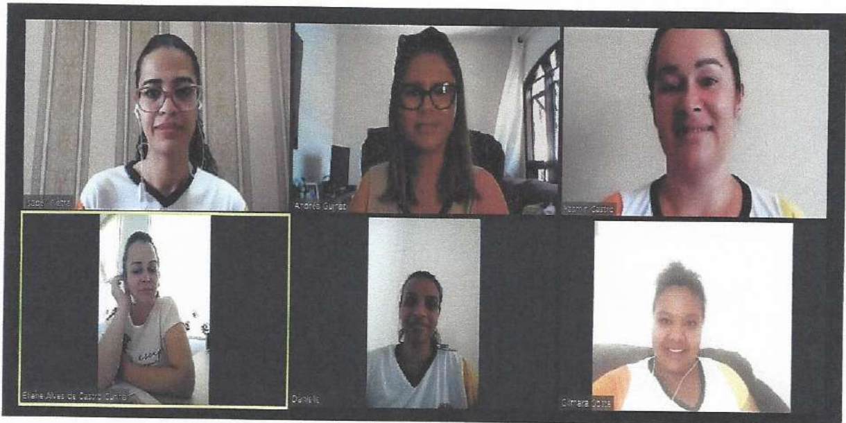
Reunião de Gestão (online) - 29/09/2020