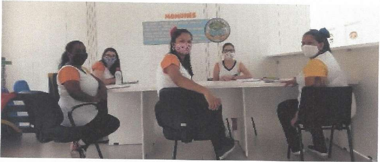
HTPC - 17/09/2020