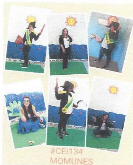
7 de setembro