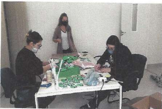
HTPC - 21/09/2020