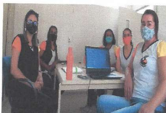
Reunião de gestão - 08/09/2020