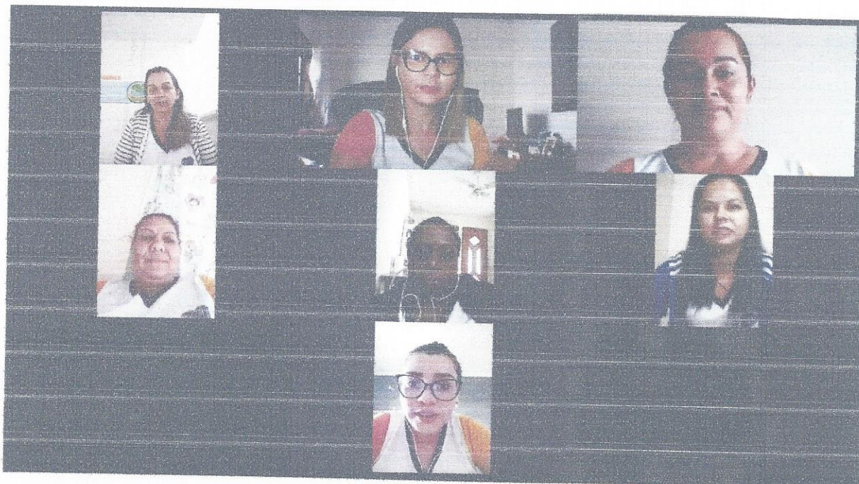
Reunião de HTPC – Tema: Avaliação Pedagógica. Reunião registrada em ata de HTPC, com data de 29/07/2020

CEI 134 "Jandira Barrada da Silva" - Gestão Compartilhada MOMUNES Rua Dr. Estácio Coimbra, 240 Vl. Santa Clara, CEP: 18066-140 FONES: 55 15 99841.2019 E-mails: cei134@momunes.org.br - coordenacaotecnica@momunes.org.br SITE: www.momunes.org.br facebook.com/mmndesorocaba