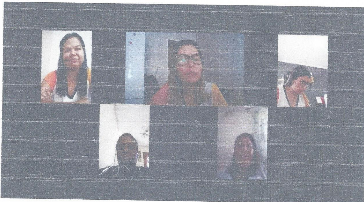
Reunião de HTPC – Tema: ANPs. Reunião registrada em ata de HTPC, com data de 22/07/2020