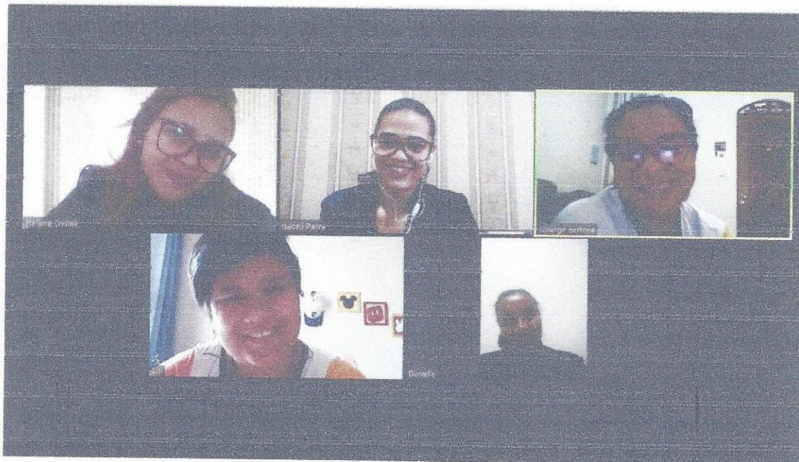
18/05/2020- Reunião de orientação com a equipe de professoras