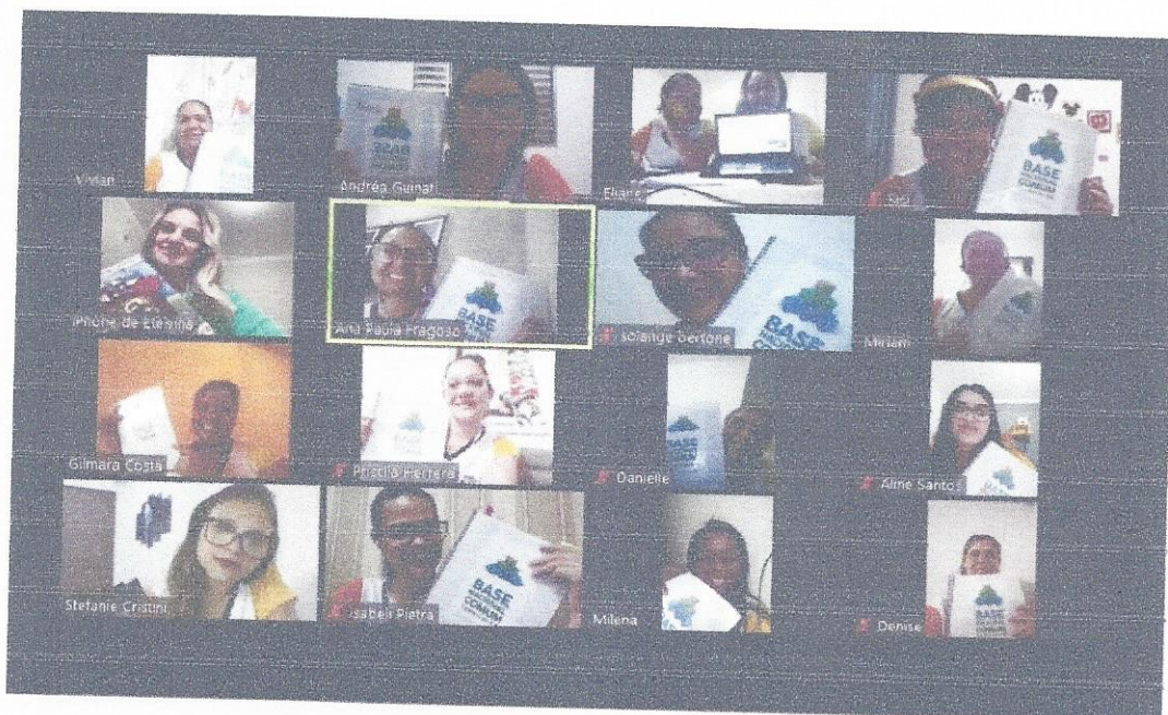
21/05/2020- HTPC de Treinamento BNCC