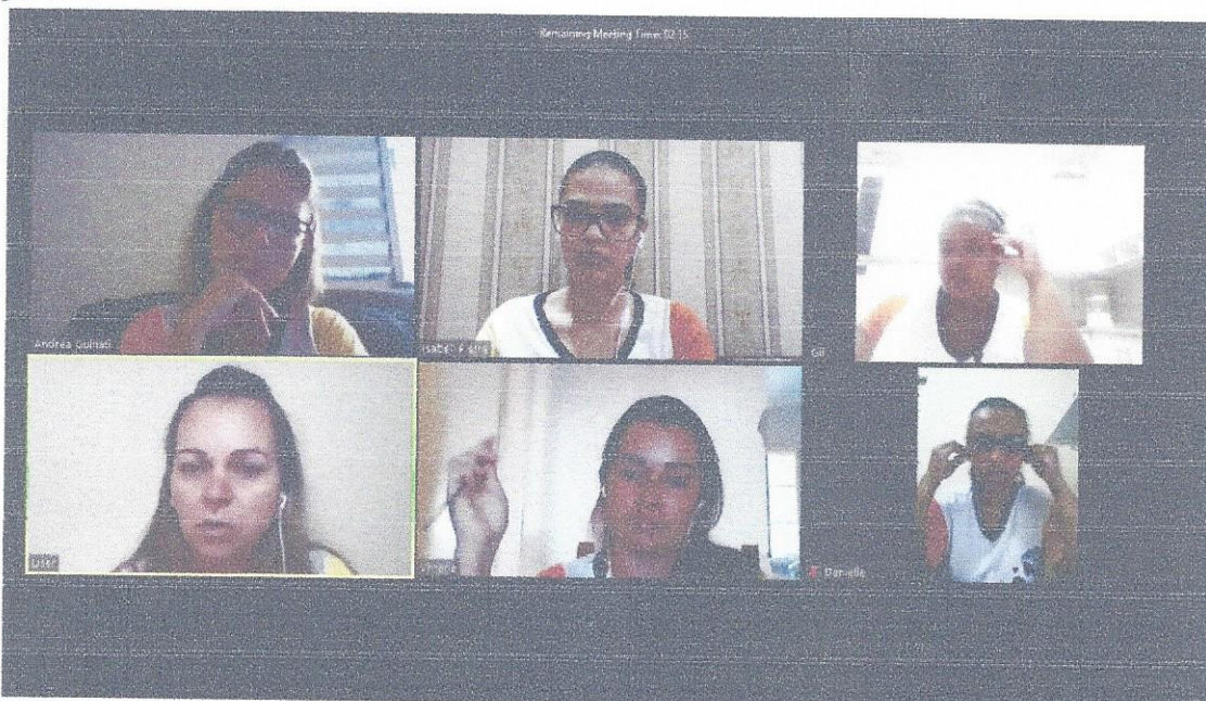
15/05/2020- Reunião da Equipe Gestora