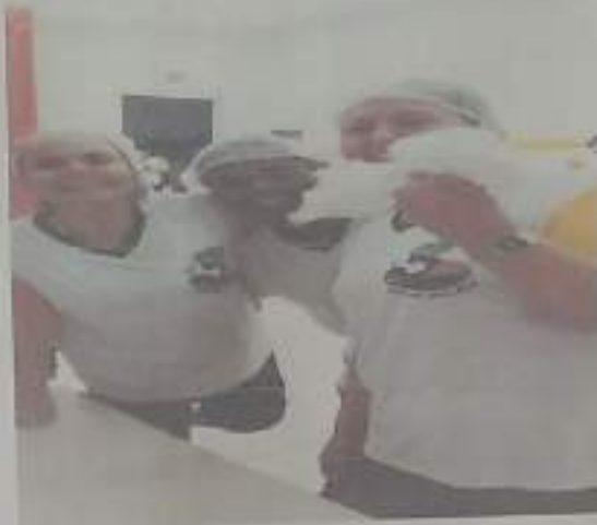
Atividade de Tinta comestível