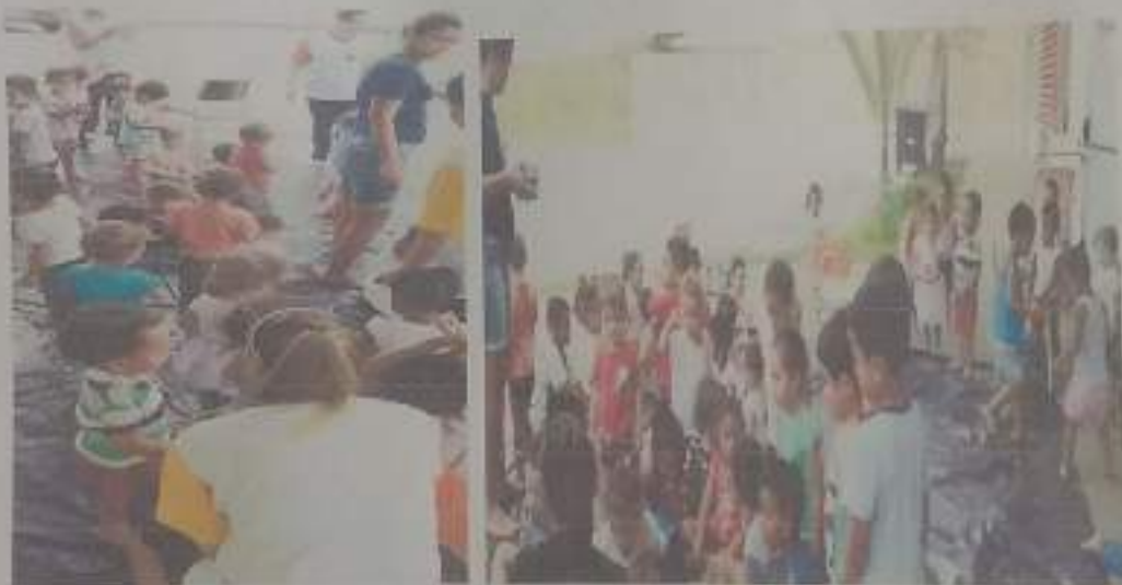
Festa a Fantasia – Desfile