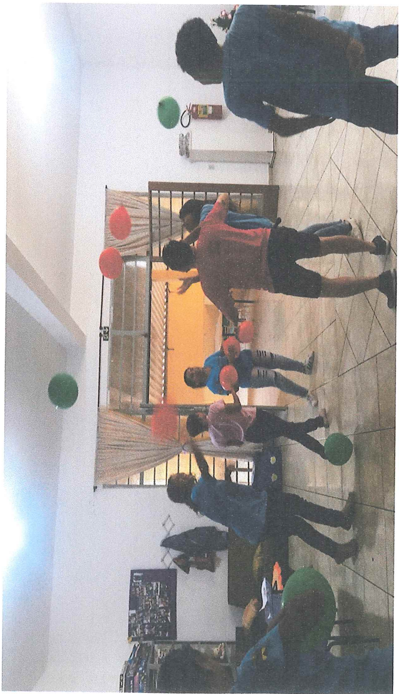
ENSAIO APRESENTAÇÃO DE NATAL