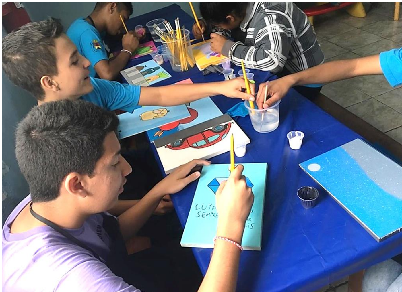
OFICINA – “PINTURA SOLIDÁRIA”