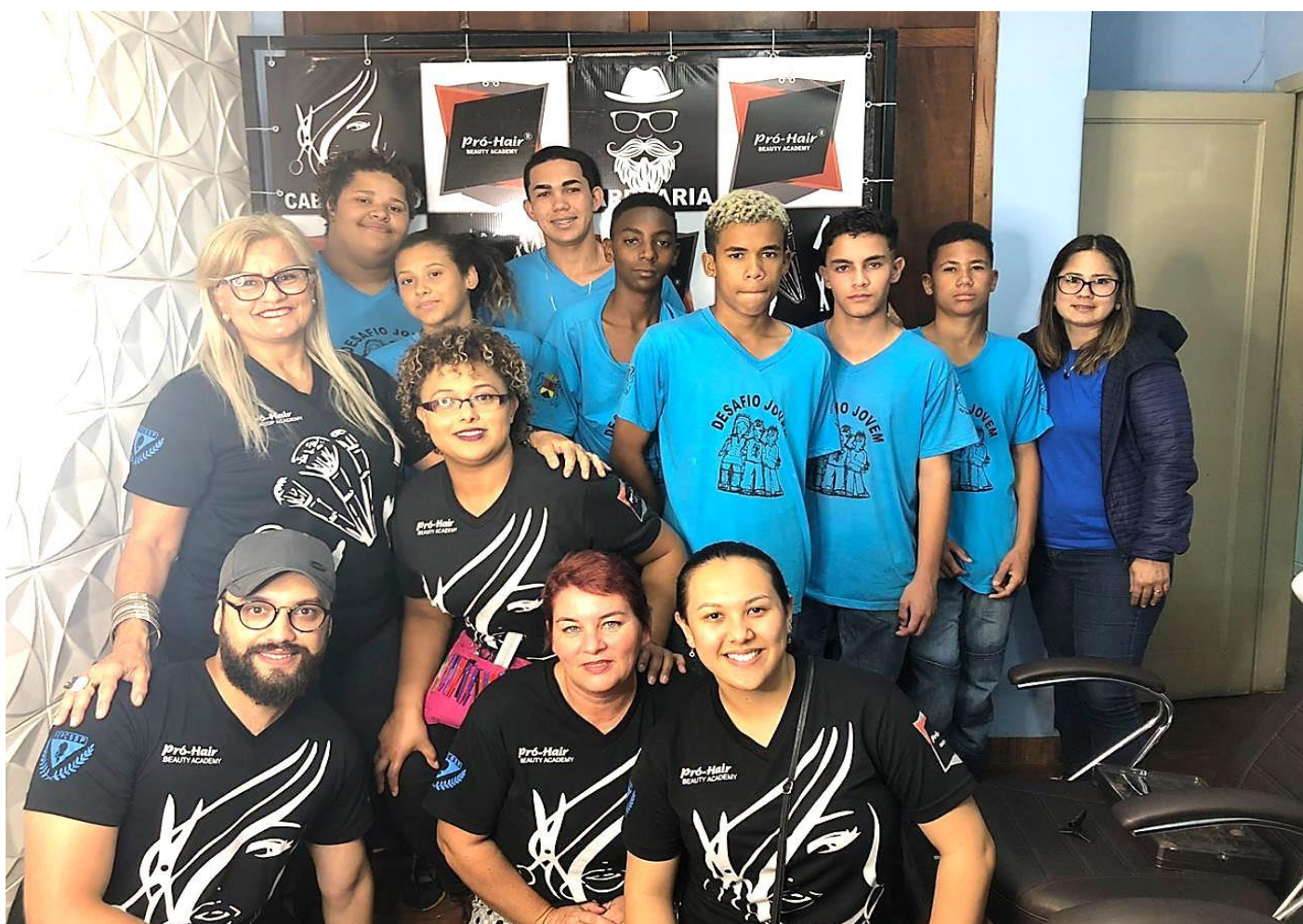
“CURSO TÉCNICO DE CORTES MASCULINOS E FEMININOS” - AULAS PRÁTICAS