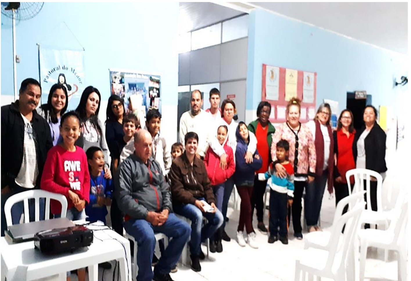
ENCONTRO DE GERAÇÕES – “CINE FAMÍLIA”