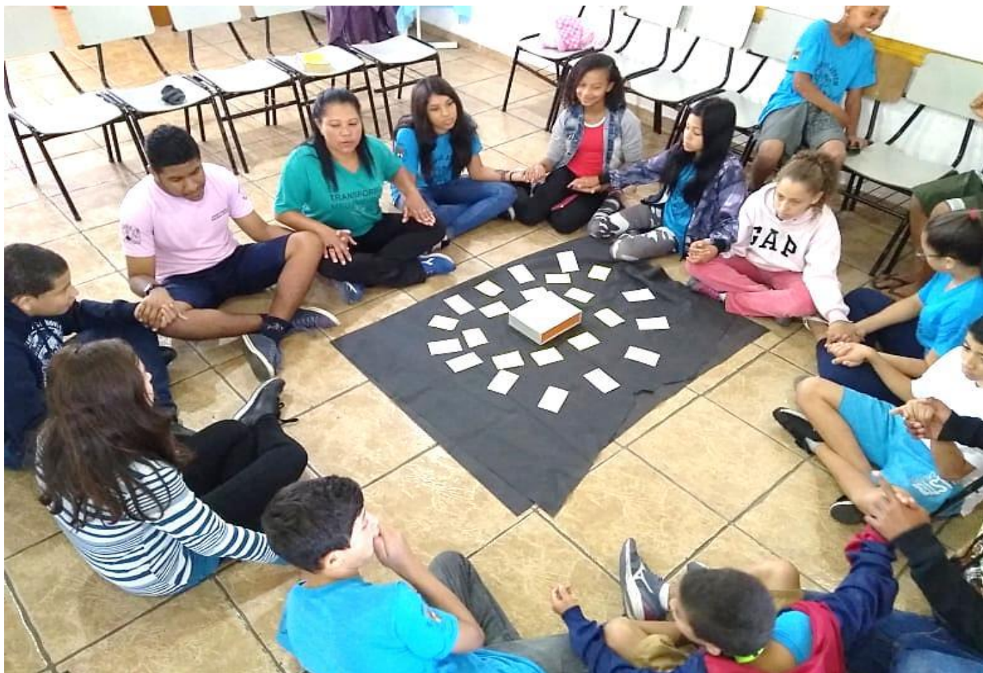
BATE PAPO – OFICINA “VIVENDO ENTRE GERAÇÕES”