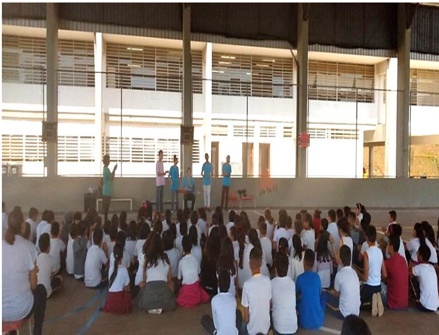
INTERVENÇÃO NA COMUNIDADE - TEMA "BULLYING" (ESCOLAS DA REDE PÚBLICA)