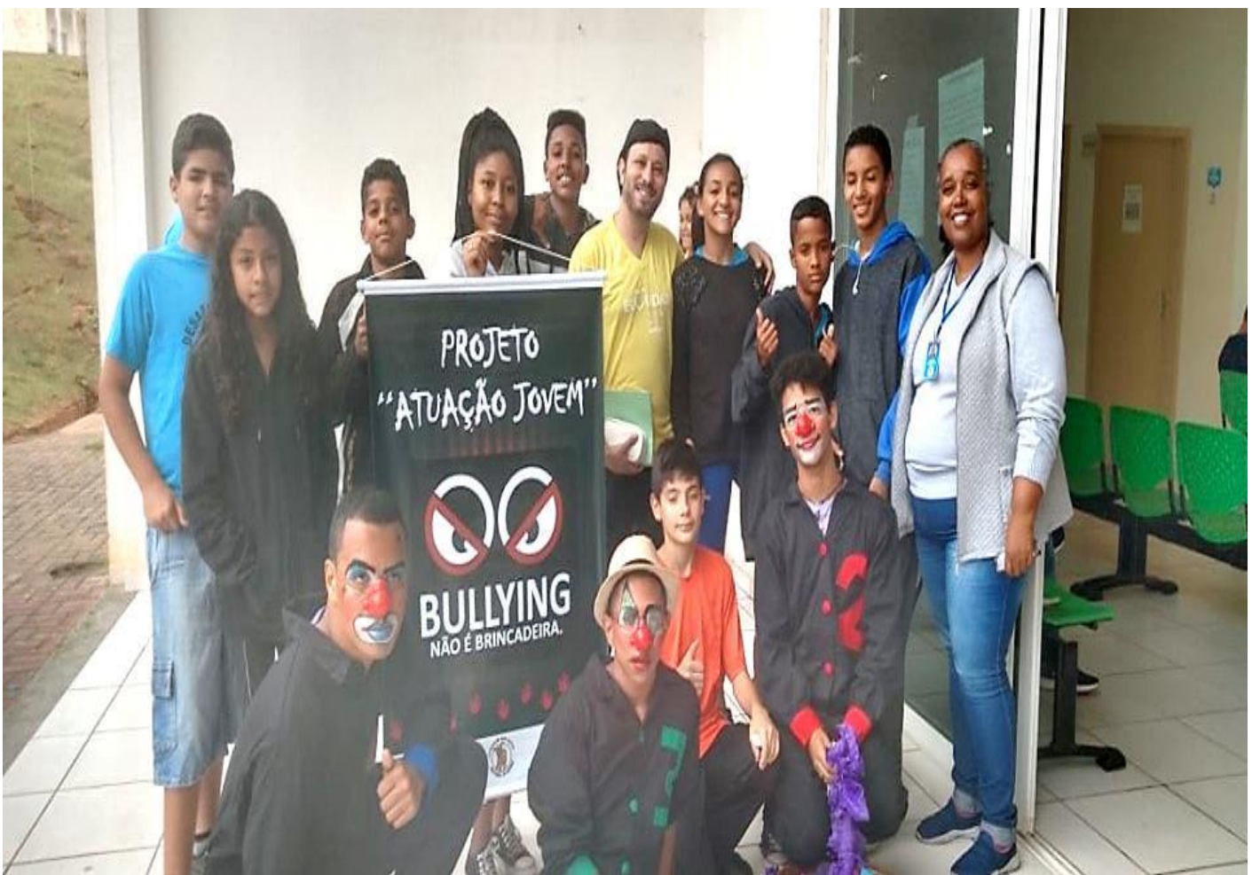
INTERVENÇÃO NA COMUNIDADE -TEMA “BULLYING” (UBS)