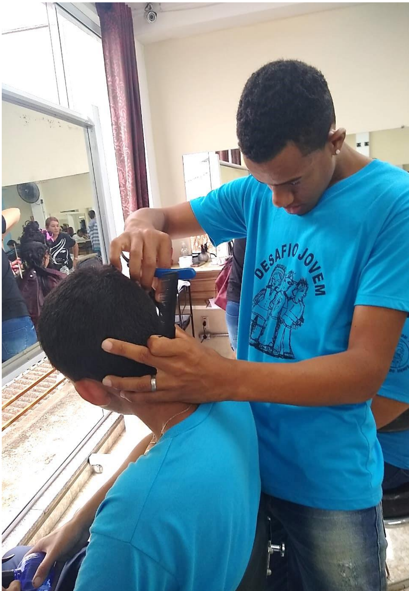
“CURSO TÉCNICO DE CORTES MASCULINOS E FEMININOS” - AULAS PRÁTICAS