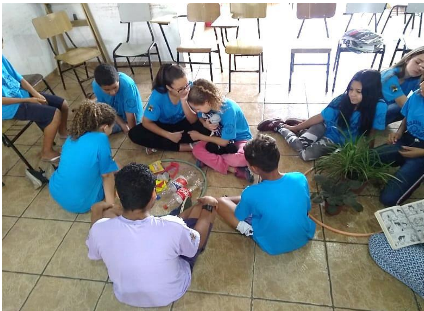
PARTICIPAÇÃO DEMOCRÁTICA: “CIDADANIA”