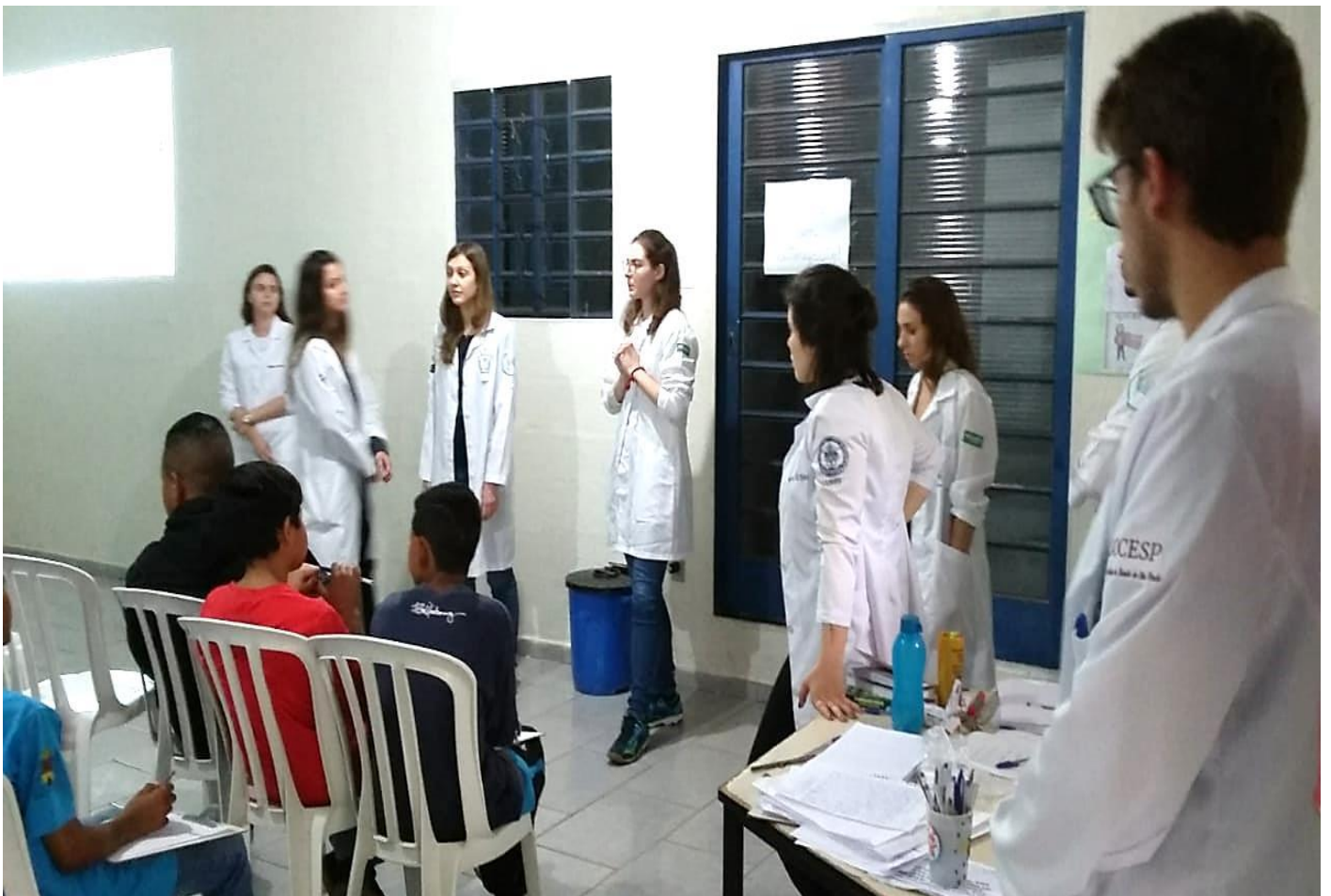
“PALESTRA DE ENFERMAGEM”