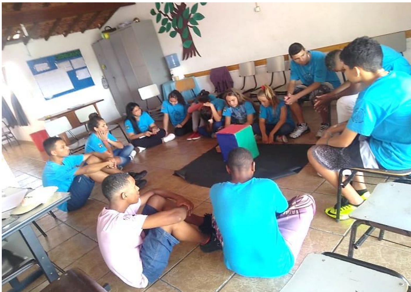
“BATE-PAPO” (ESCOLA, FAMÍLIA E FIM DE SEMANA)