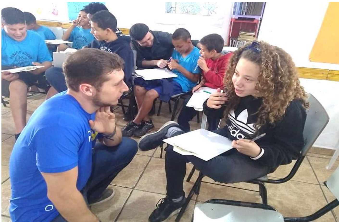
“PROJETO GAIA +”