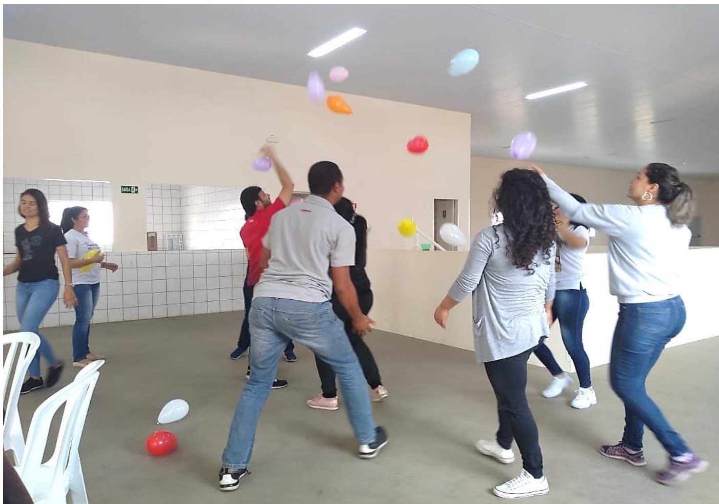
REUNIÃO PEDAGÓGICA – “SETEMBRO AMARELO”