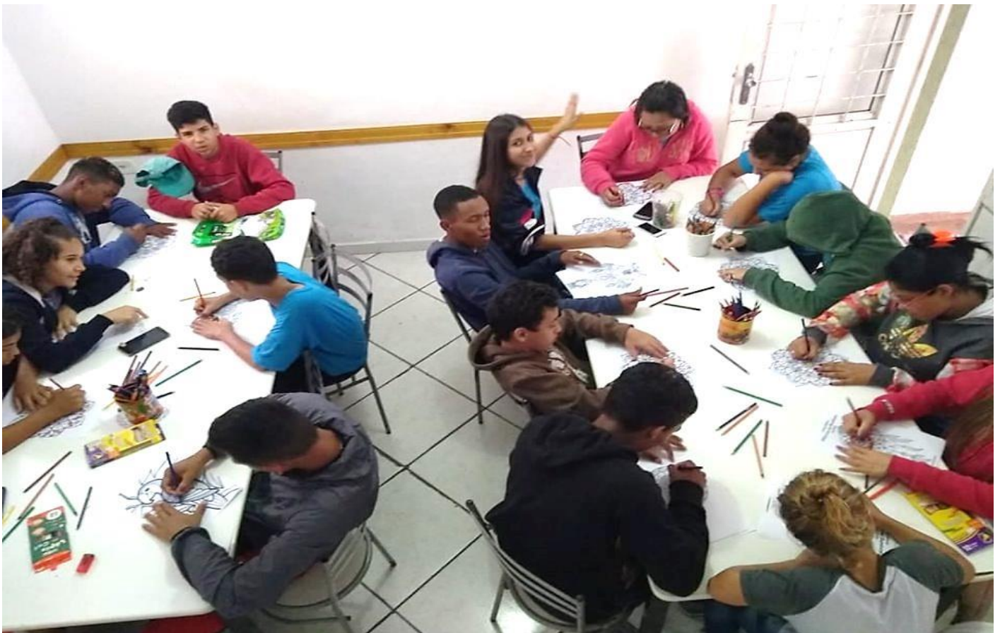
OFICINAS DE "CIDADANIA E PROTAGONISMO"