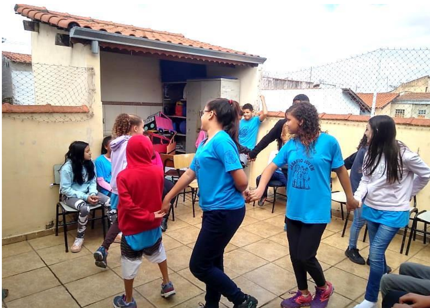
“JOGOS COOPERATIVOS / RECREAÇÃO DIRIGIDA”