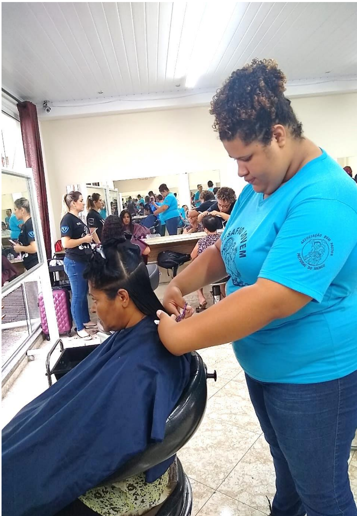
“CURSO TÉCNICO DE CORTES MASCULINOS E FEMININOS” - AULAS PRÁTICAS