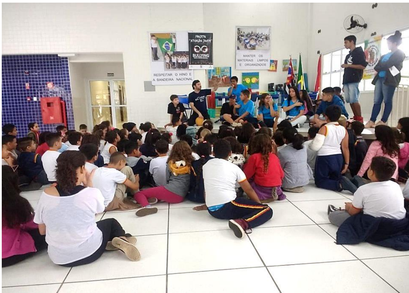
INTERVENÇÃO NA COMUNIDADE - TEMA “BULLYING” (ESCOLAS DA REDE PÚBLICA)