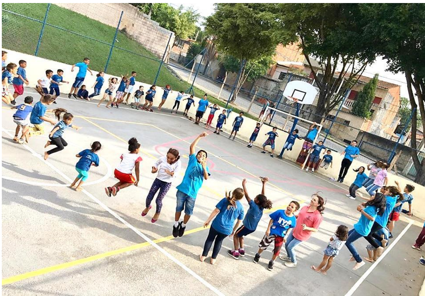
“TRABALHO DE CAMPO”