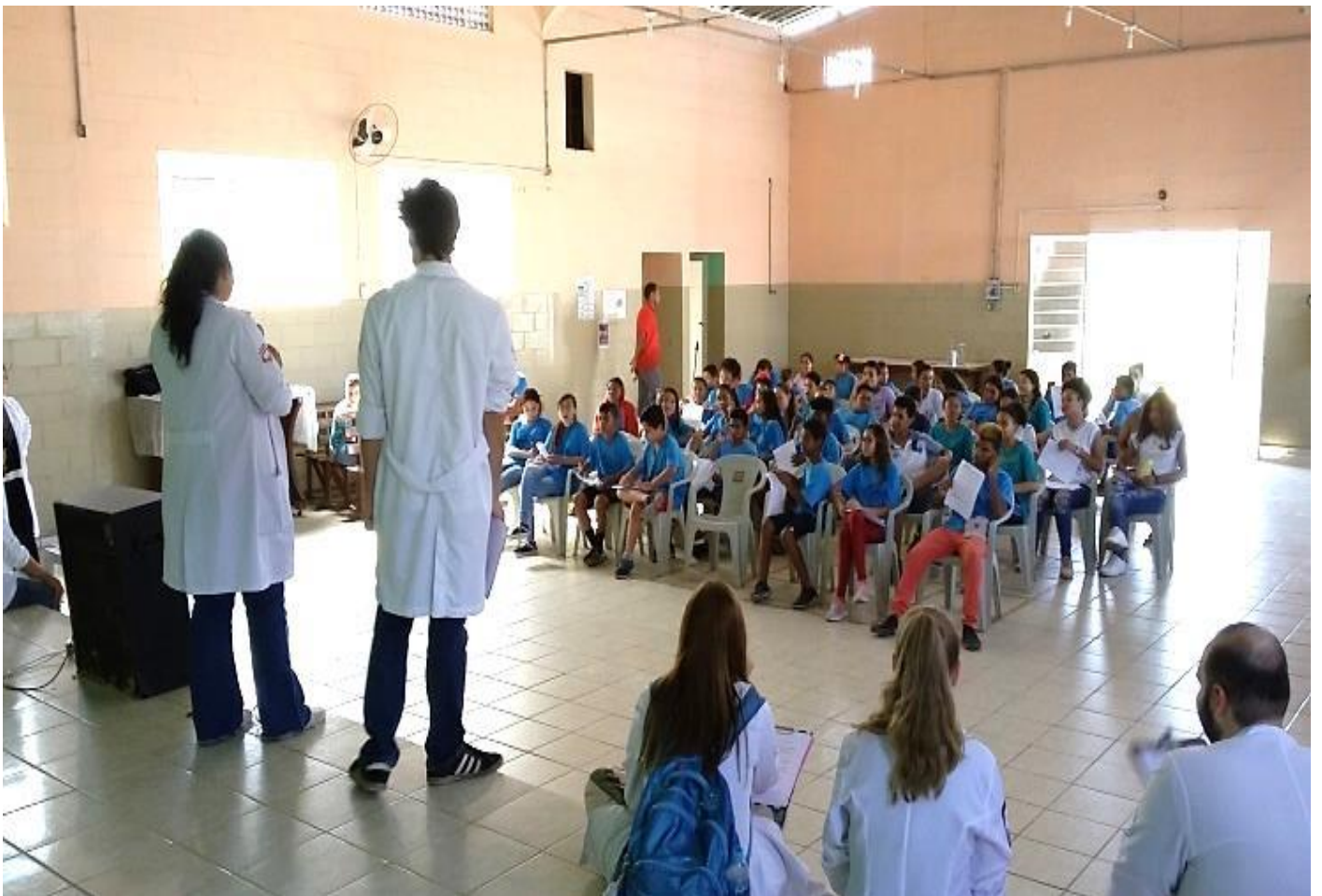
“TESTE DE SÍFILIS”