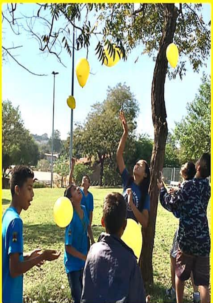
ENCONTRO – “SETEMBRO AMARELO” (PREVENÇÃO DO SUÍCIDO)