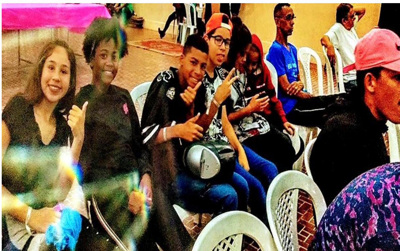
VISITA EXTERNA - APRESENTAÇÃO DA DANÇA REFERENTE AO TEMA “ECA”