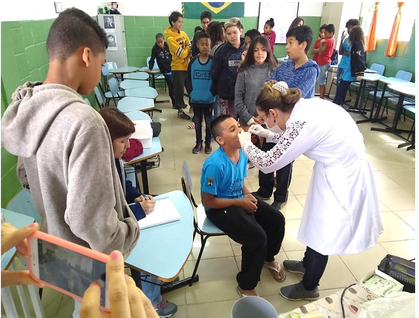
“PALESTRA DE ENFERMAGEM”