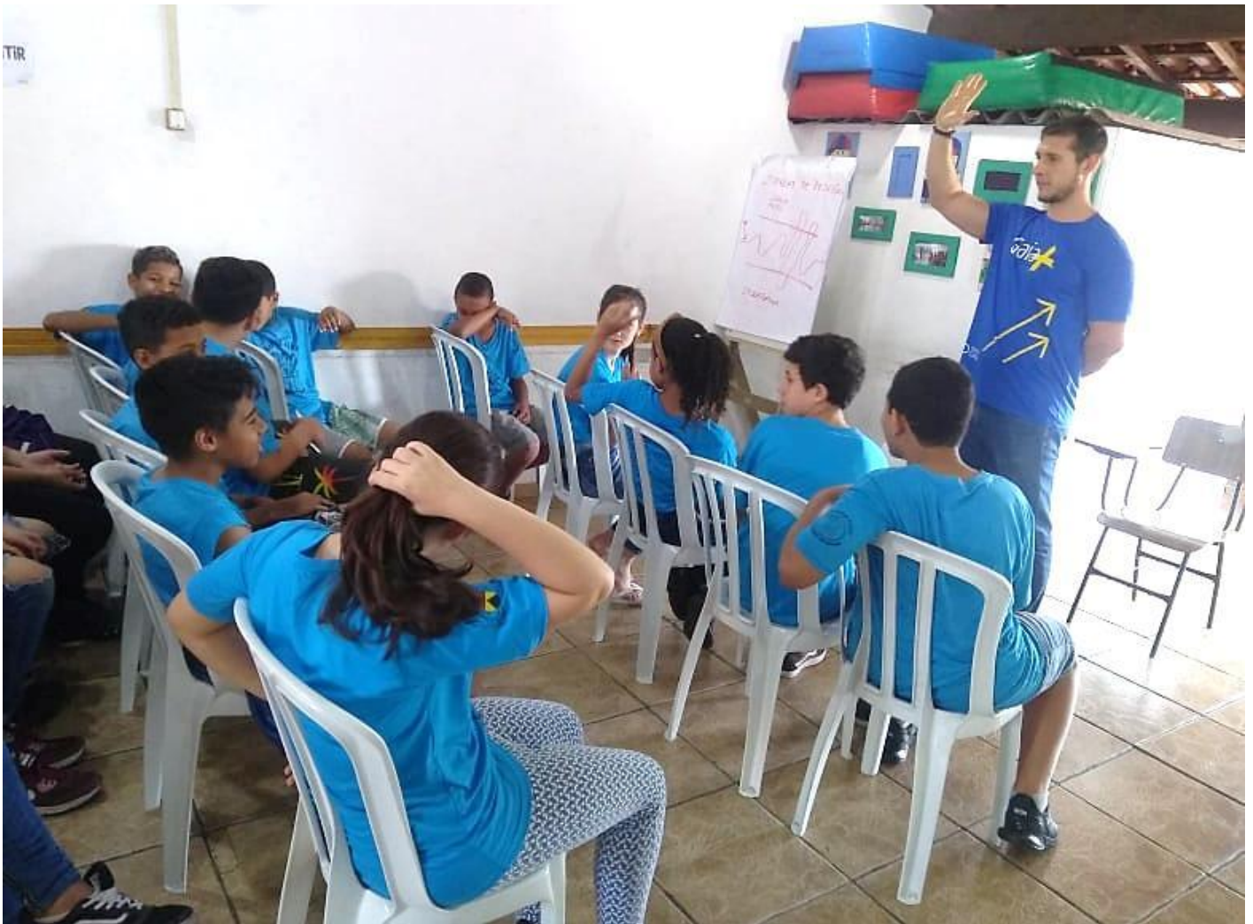
“PROJETO GAIA +”