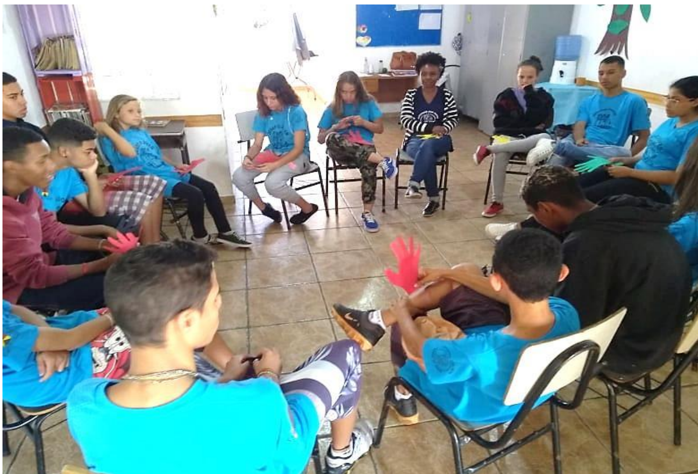
“OFICINAS DE CIDADANIA E PROTAGONISMO”