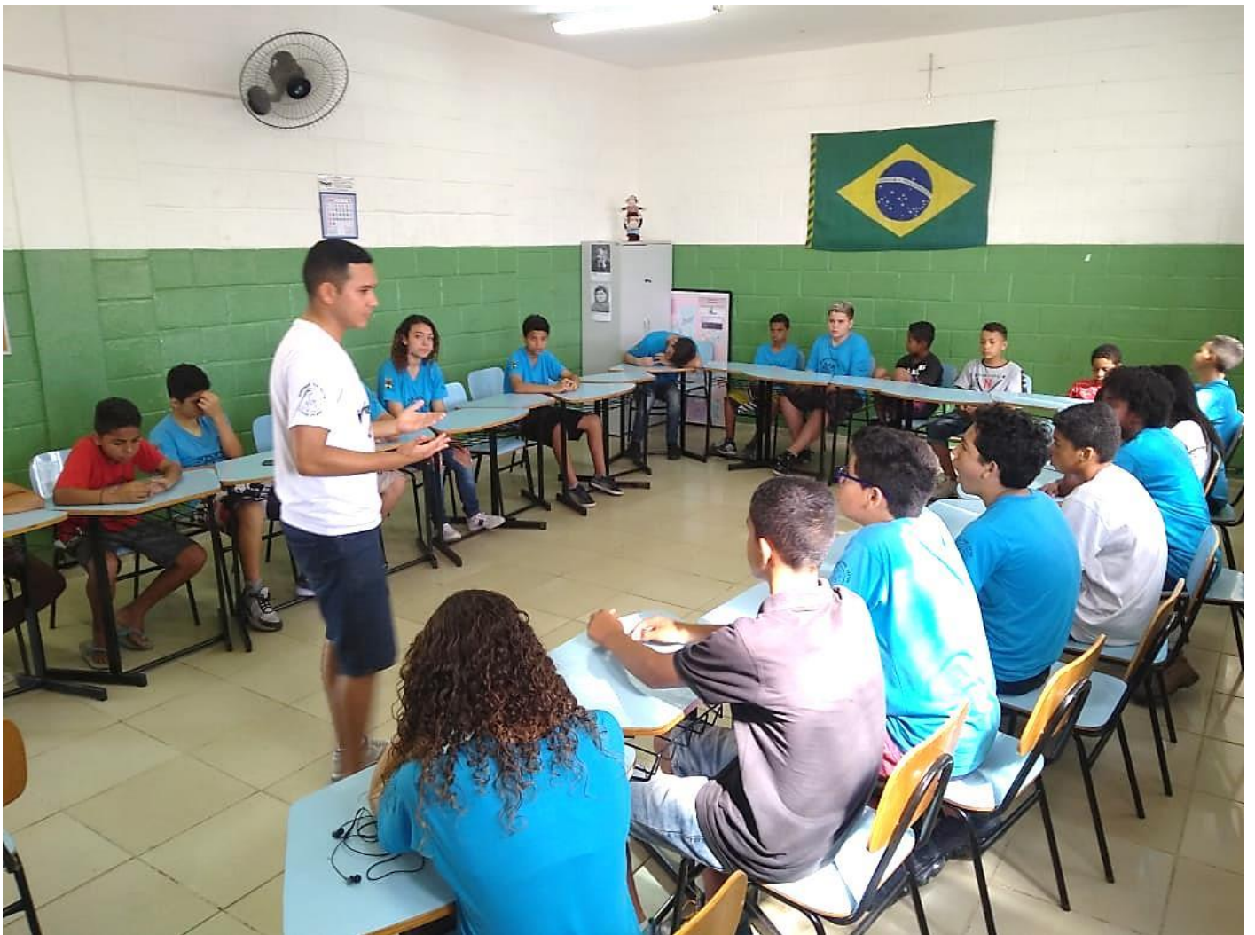
“OFICINAS DE CIDADANIA E PROTAGONISMO”