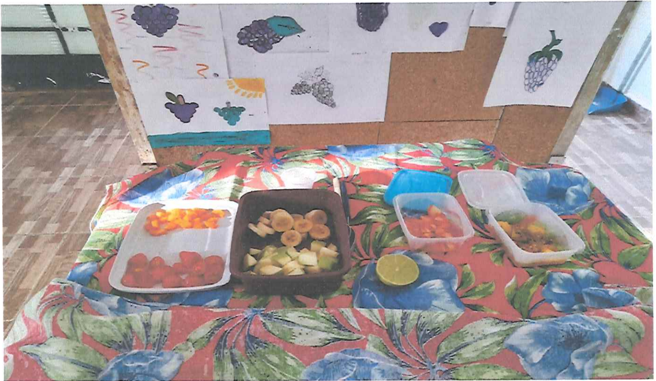
Dia de Brincar: Tema: "Cidadania e Cultura de Paz". Subtema: Alimentação Saudável, degustação as cegas.