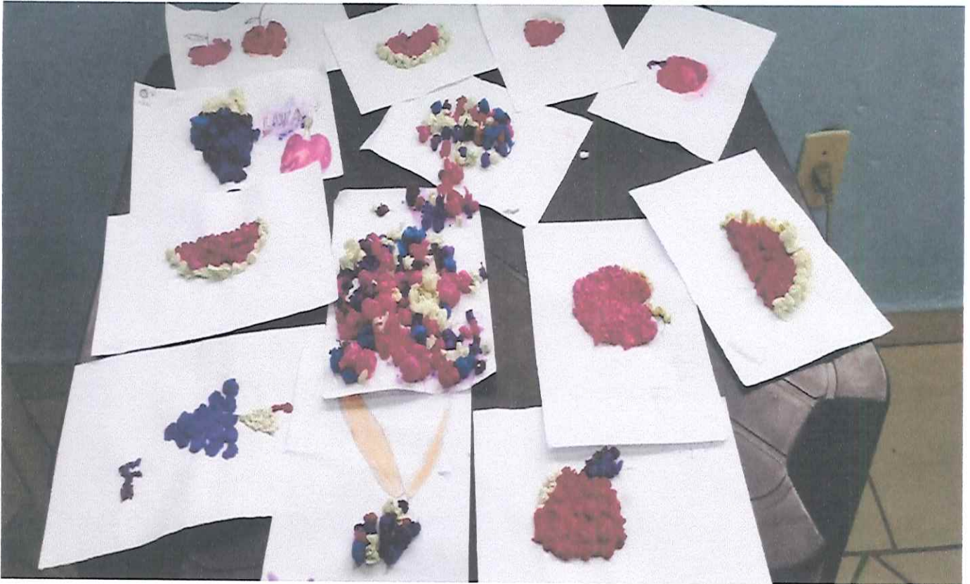
Dia de Arte. Tema: "Cidadania e Cultura de Paz". Subtema: Alimentação saudável, pinturas com bolinhas de crepom.