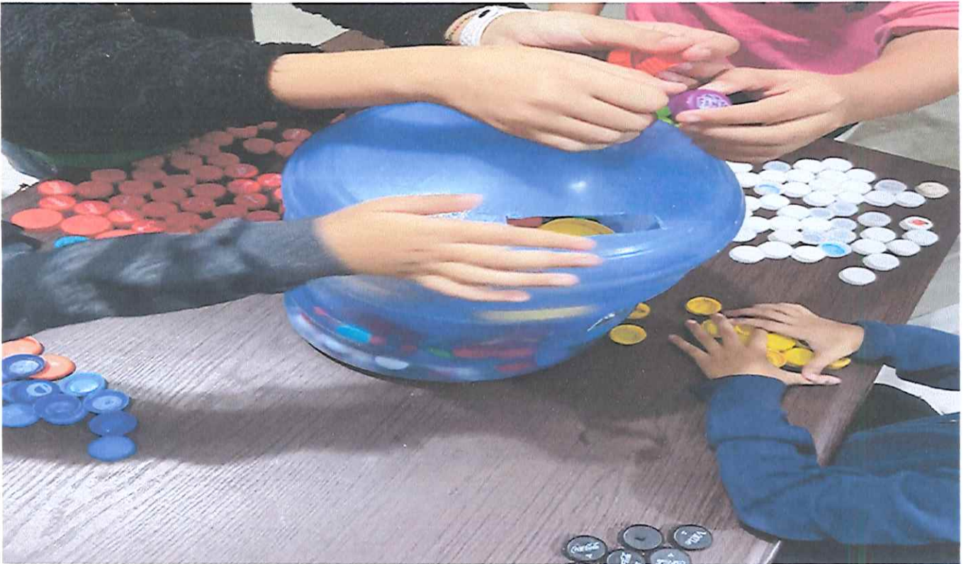
Oficina de Convivência. Tema: "Cidadania e Cultura de Paz". / Subtema: Higiene Bucal/ separação das tampinhas para campanha.