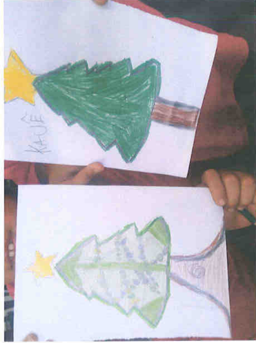
“BATE PAPO COM AS FAMÍLIAS”