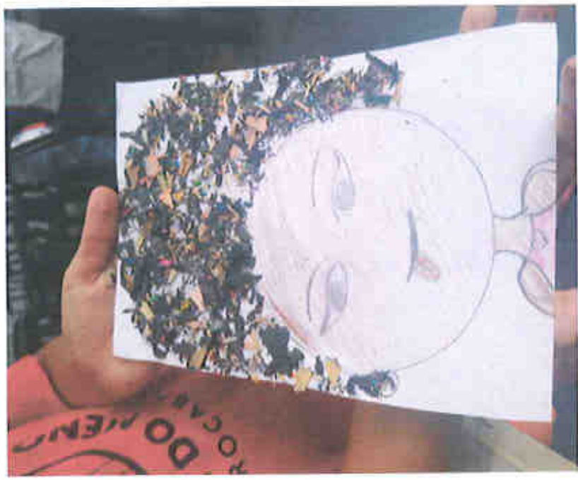
"DIA DE ARTE"