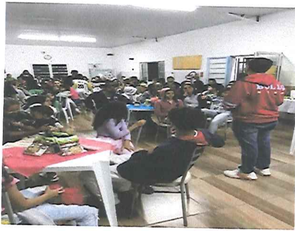
“ENCONTRO DE GERAÇÕES”