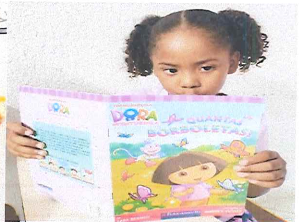
“CIDADANIA E CULTURA DE PAZ”