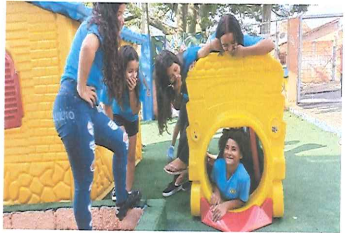
“ESPORTE, RECREAÇÃO E LAZER”