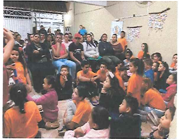
“ENCONTRO DE GERAÇÕES”