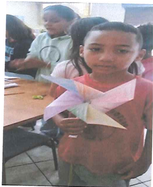
“DIA DE ARTE”