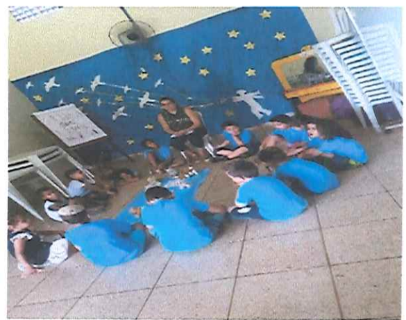
“SENTA QUE LÁ VEM A HISTÓRIA”