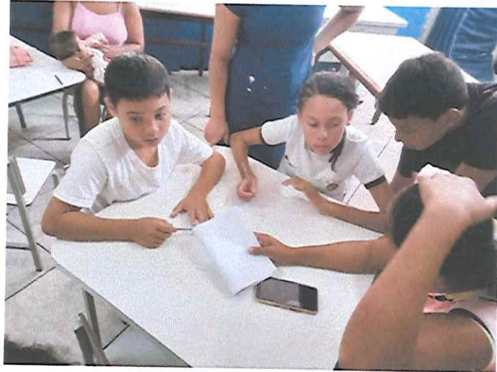
Encontro intergeracional CEC Habiteto