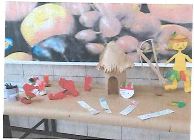
“DIA DE ARTE”