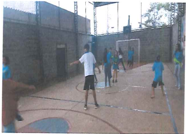
“ESPORTE, RECREAÇÃO E LAZER”