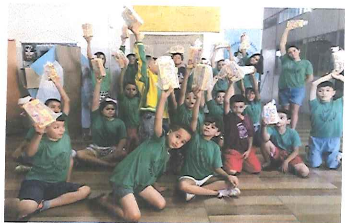
“FESTA DA PASCOA”