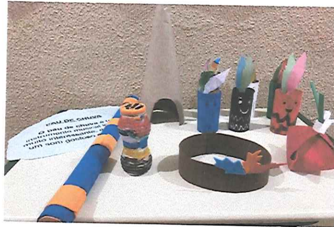
“DIA DE ARTE”