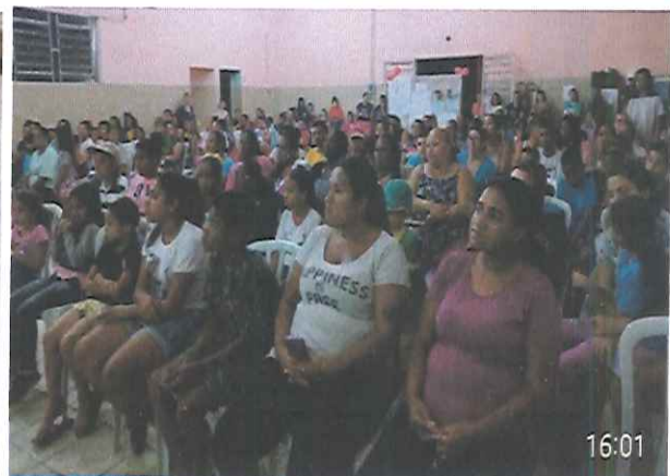
“ENCONTRO DE GERAÇÕES”