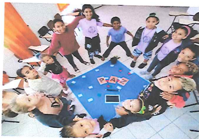
“AUTOCONHECIMENTO DESENVOLVIMENTO PESSOAL E EMOCIONAL”