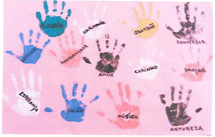
“CIDADANIA E CULTURA DE PAZ”