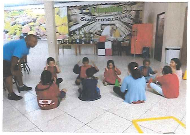
“ESPORTE, RECREAÇÃO E LAZER”