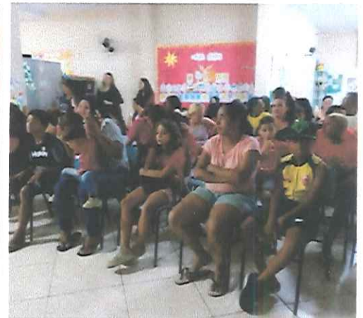
“ENCONTRO DE GERAÇÕES”