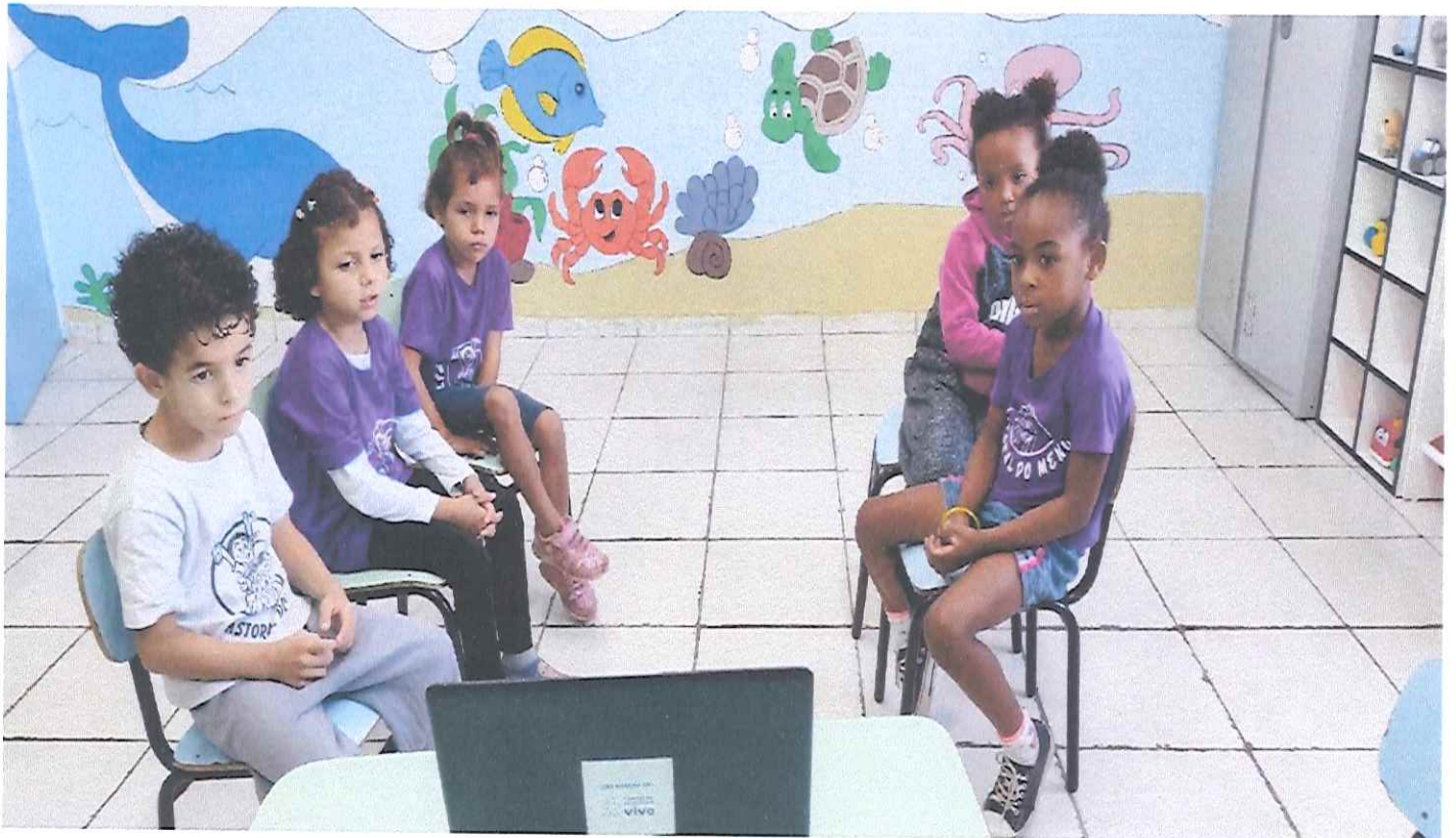
Trabalho presencial: Senta que lá vem a história: Tema: Eu com quem cuida de mim. Subtema: Fábula A cigarra e a formiga