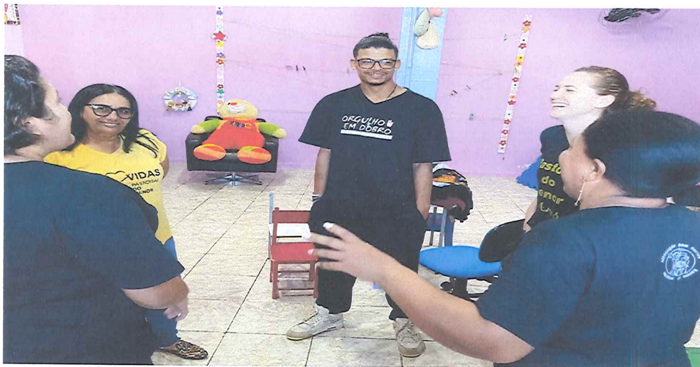
Trabalho presencial: Encontro Pedagógica.