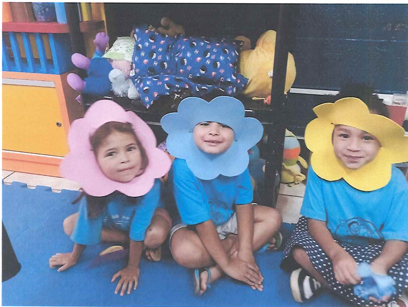
Trabalho presencial- Dia de Arte- Brincadeiras dirigidas. Tema: Eu com quem cuida de mim. Subtema: Música: linda rosa juvenil, após ensaiar, gravar um vídeo com as crianças