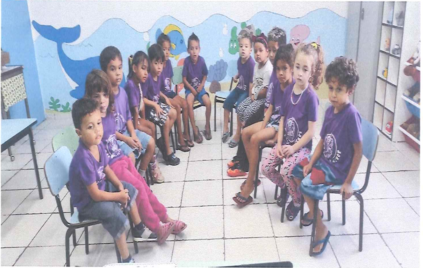
Trabalho presencial: Oficinas de Convivência / Tema: Eu com quem cuida de mim. Subtema: Dia do trabalhador.