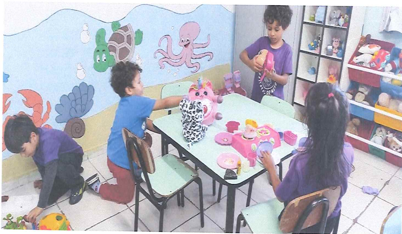
Trabalho presencial- Dia de brincar. Tema: Eu com quem cuida de mim. Subtema: Brincadeiras livres. A criança escolhe a brincadeira