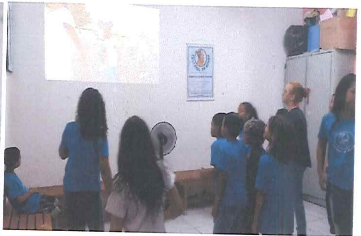
Trabalho/Presencial - Oficina de Convivência. Tema: Gincana gamer da Pamen / Subtema: Desafio Jerusalema, criar uma coreografia para a música envolvendo o grupo todo