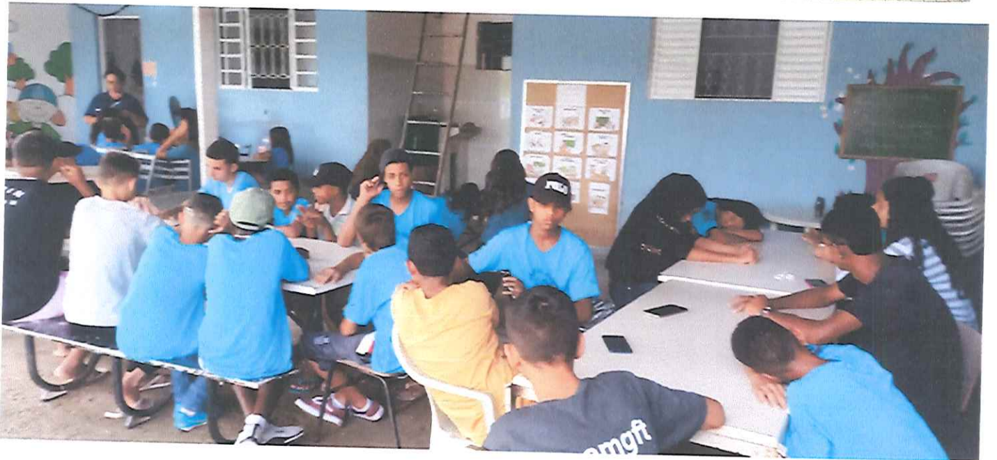
Trabalho/Presencial - Senta que lá vem a história. Tema: Gincana gamer da Pamen/ Subtema: Histórias dos Centros Educacionais da Pastoral e registro.