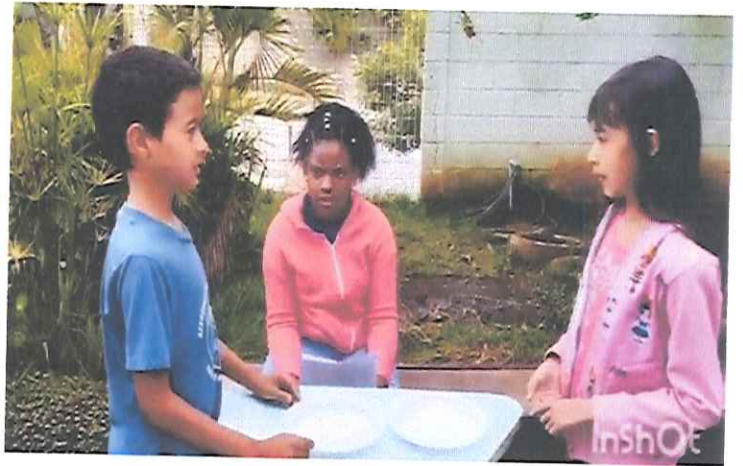
Trabalho/Presencial - Oficina de Convivência. Tema: Gincana gamer da Pamen/ Subtema: jogo de perguntas e respostas sobre a Pastoral