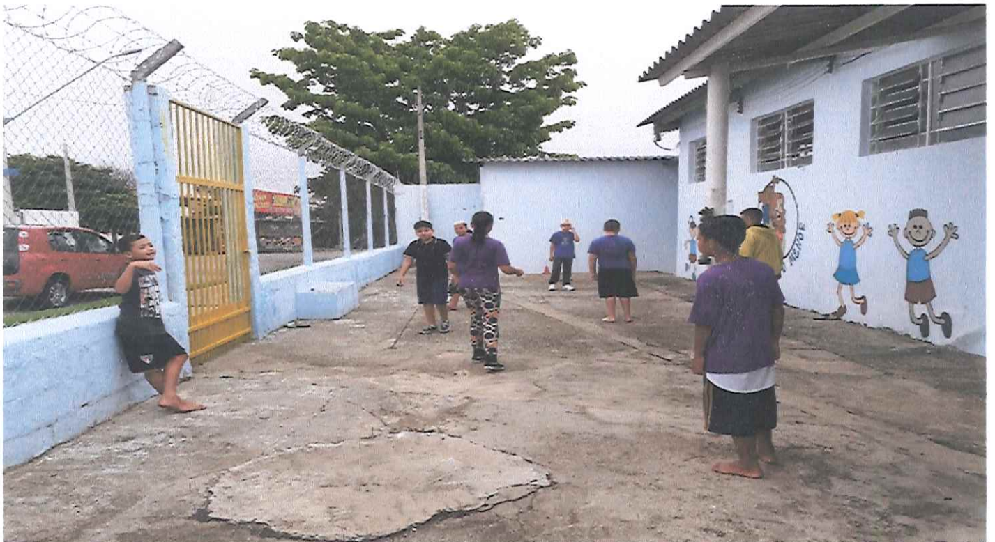
Trabalho /Presencial - Dia de Brincar: Tema: “Ubuntu no Natal”. Subtema: Rouba bandeira.