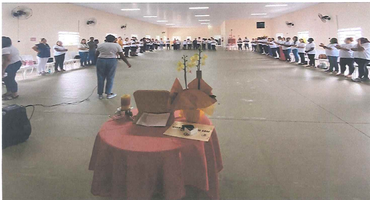
40º Encontro de Agentes Pastoral do Menor – Sorocaba.