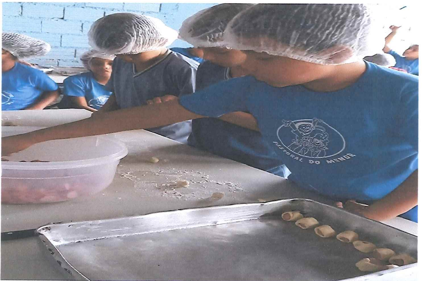
Trabalho/Presencial- Dia de Arte. Tema: “Ubuntu no Natal”. Subtema: Dia de máster chef, oficina de culinária, preparando o próprio lanche