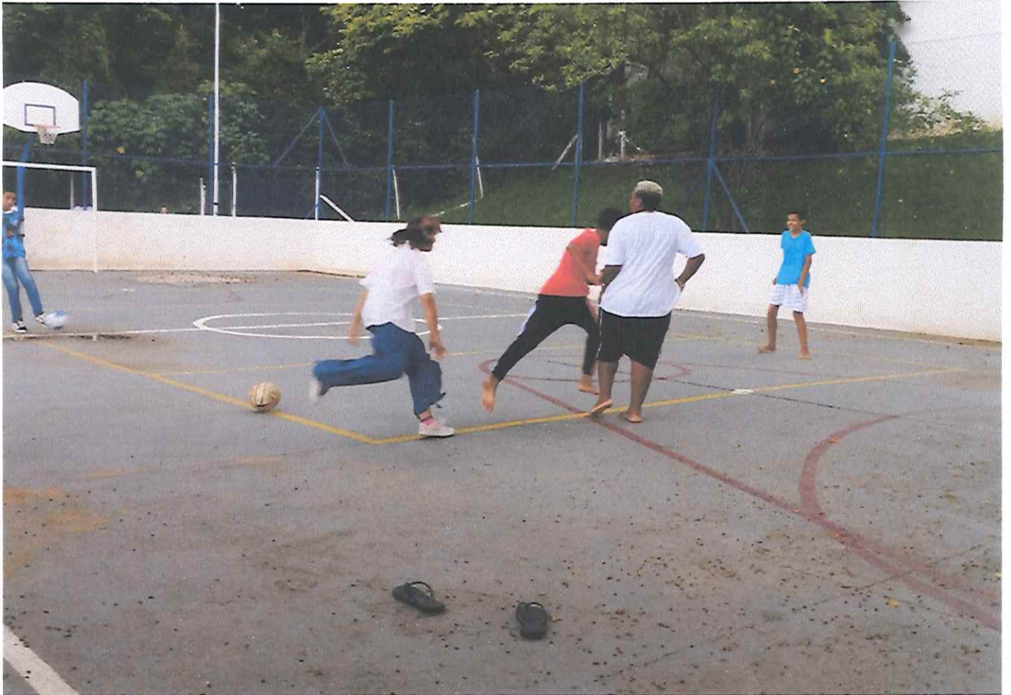
Trabalho /Presencial - Dia de Brincar: Tema: “Ubuntu no Natal”. Subtema: Futebol, dividir o time e passar as regras do jogo.