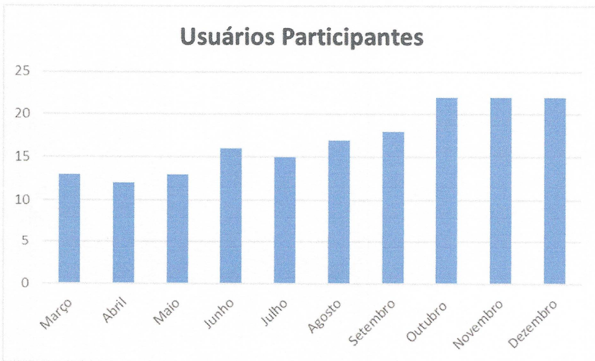
Gráfico 2. Relação da inserção de usuários no grupo de Mercado de Trabalho na metodologia do Emprego Apoiado conforme os meses do ano de 2023.